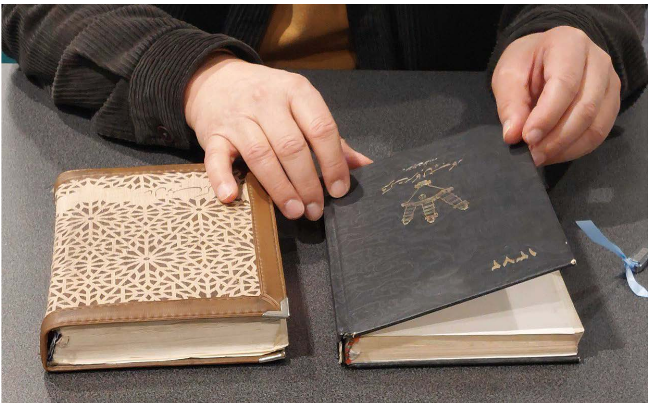
Herr N. schrieb im Gefängnis zwei Bücher über seine Erfahrungen.

Der Mut und die Entschlossenheit all dieser Menschen, die uns ihre Geschichte geschildert haben, trotz der massiven psychischen Belastungen, ist beeindruckend. Wir versuchen sie auf ihrer Suche nach Gerechtigkeit zu begleiten, an ihrer Seite zu stehen und ihnen eine Stimme zu geben. Durch Menschenrechts- und Lobbyarbeit kann mit ihrer Hilfe stärker Druck auf die Verantwortlichen der EU und ihrer Mitgliedsstaaten ausgeübt werden, das absolute Folterverbot zu respektieren und jene, die für Folter gegen Geflüchtete verantwortlich sind, vor Gericht zu stellen. Denn: „Gerechtigkeit heilt“!